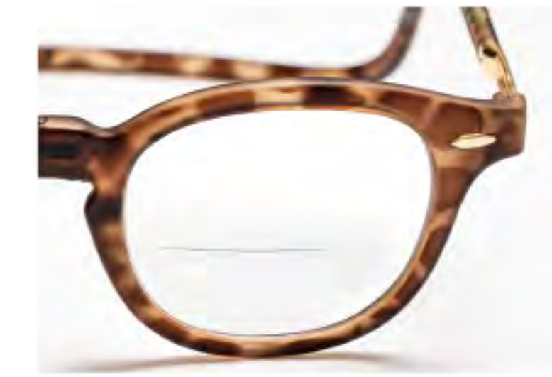
VEX-4 ライトトートイス (VLT-EX)