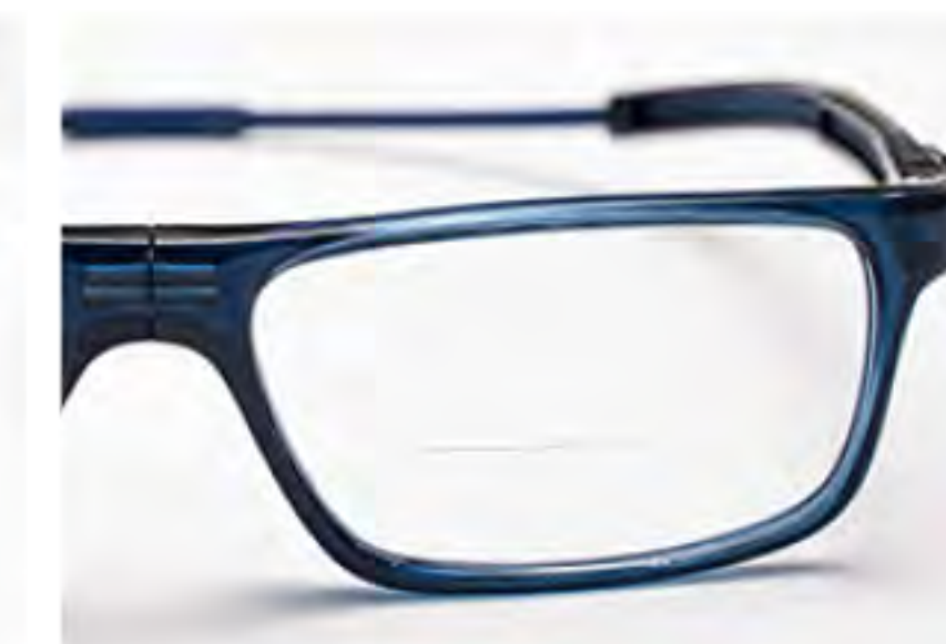
TEX-4 ネイビーブルー (TNB-EX)