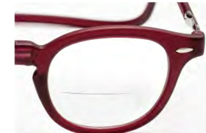
VEX-6 ボルドー (VWR-EX)