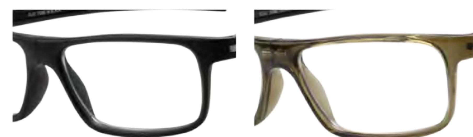
T-1 マットブラック (TMB)