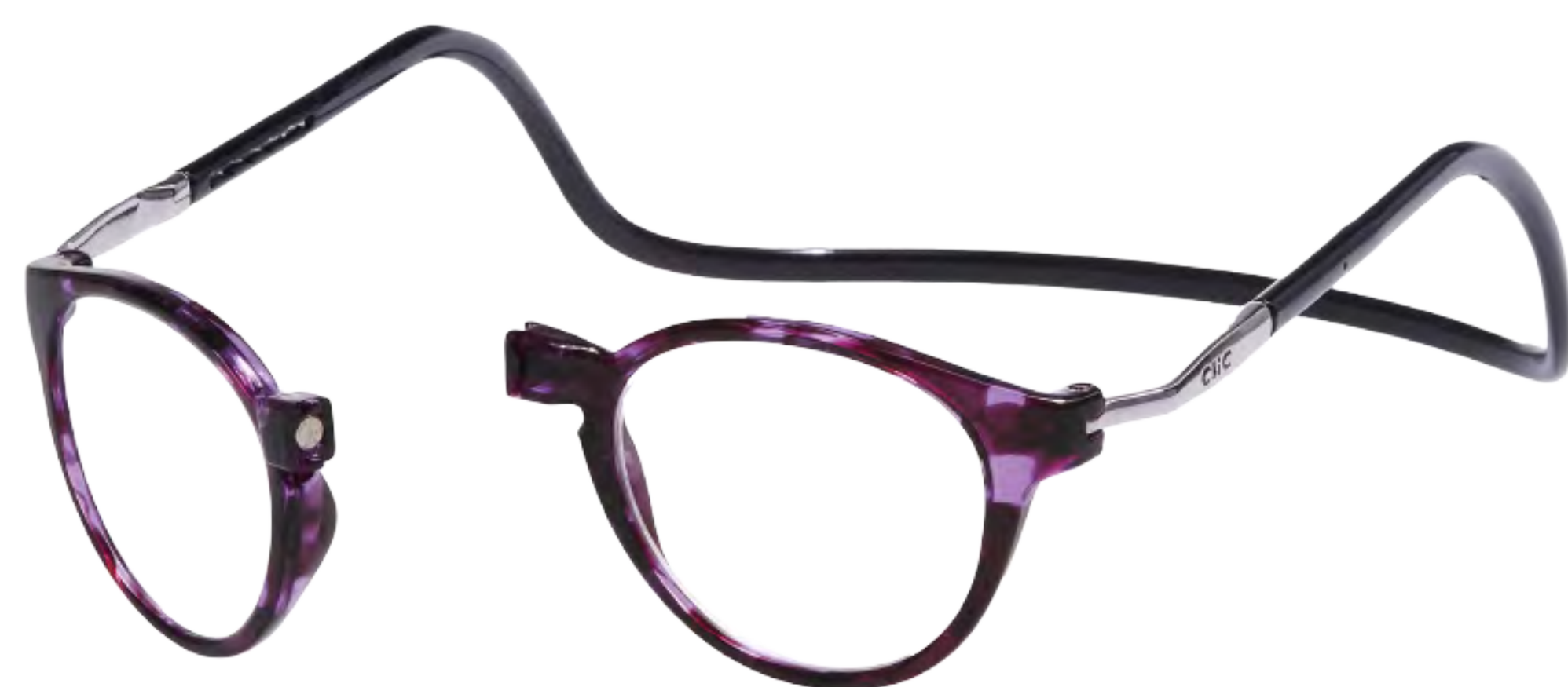
PS-5 パープルデミ/ブラック(PDB)