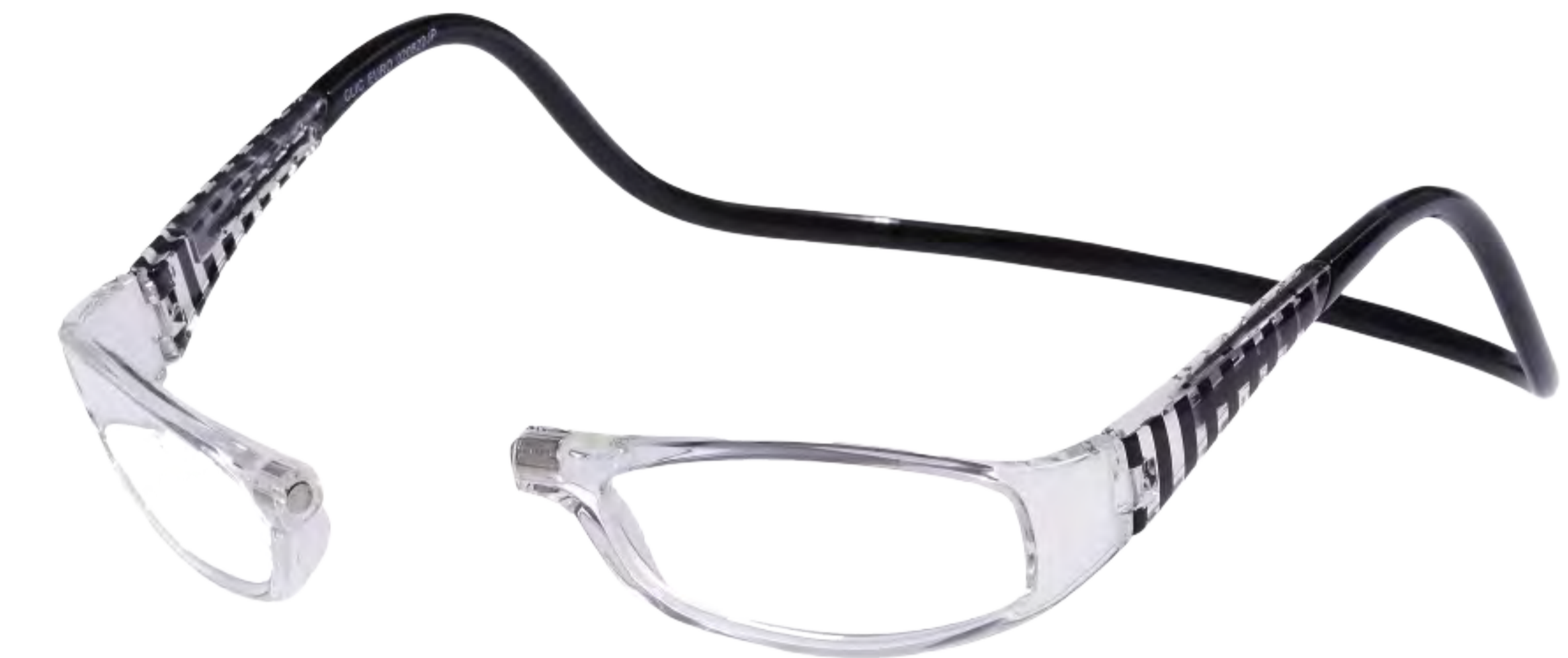
E-3 ブラック&クリアー(EBC)