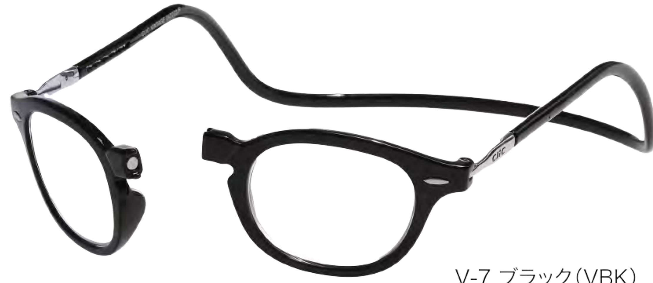
V-7 ブラック (VBK)