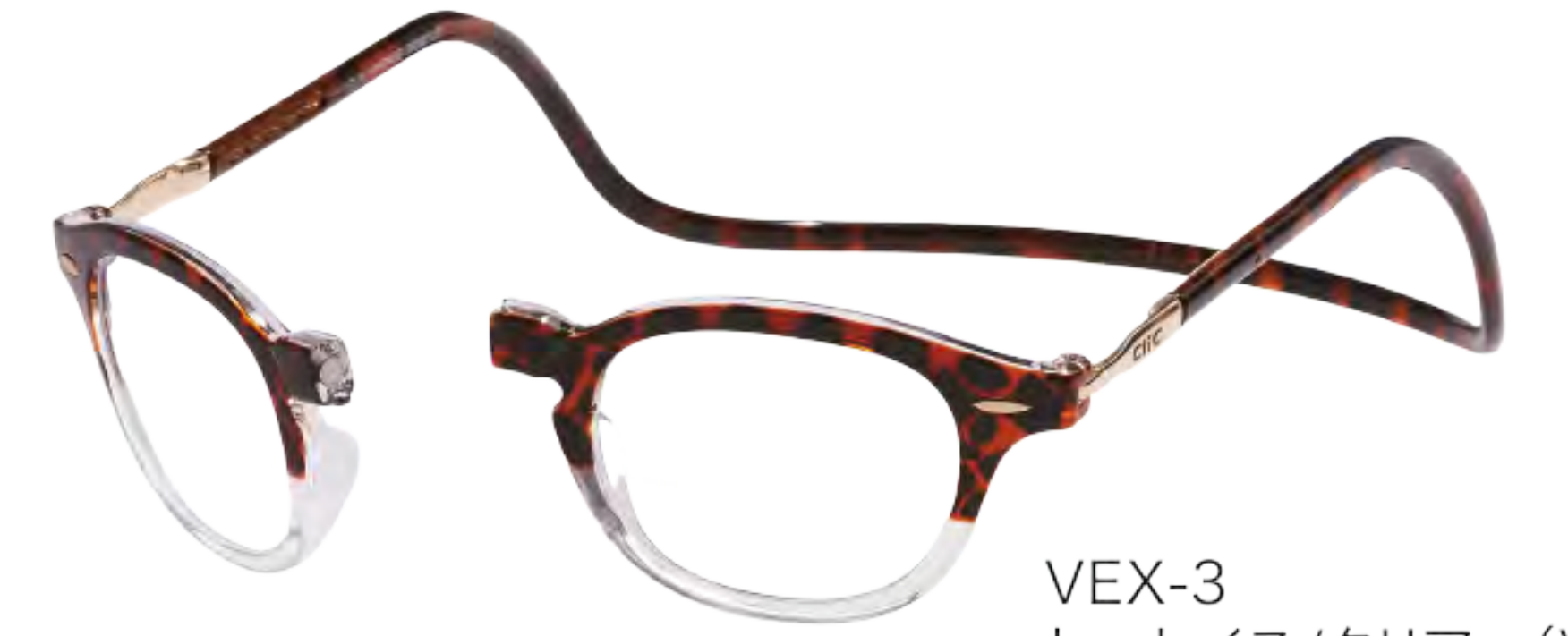
VEX-3 トートイス/クリアー (VTC-EX)