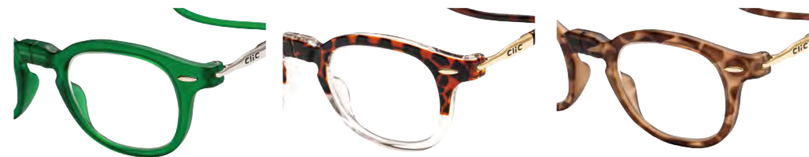
V-2 エメラルドグリーン (VEG)