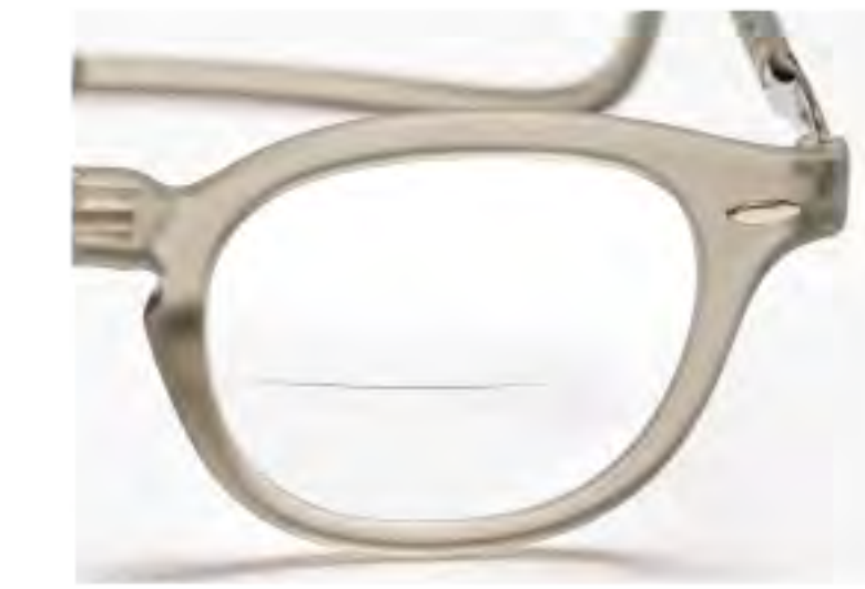
VEX-5 クリアグレー (VGR-EX)