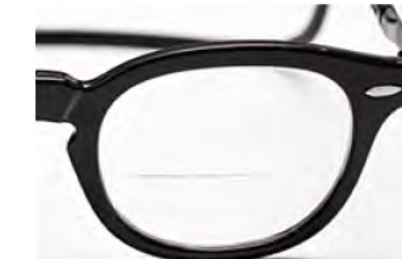
VEX-7 ブラック (VBK-EX)