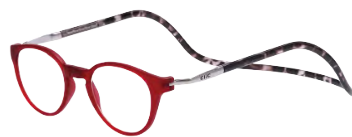
PS-2 マットレッド/ブラックデミ(RBD)