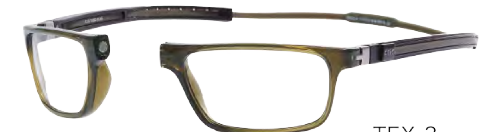
TEX-3 オリーブ (TOV-EX)