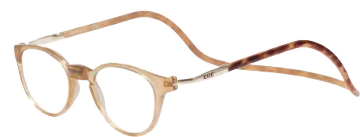
PS-3 ブロンド/ブロンドデミ(BBD)