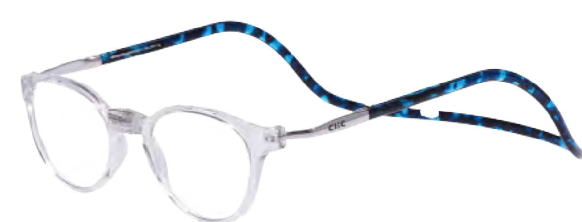
PS-1 クリアー/ブルーデミ(CBD)