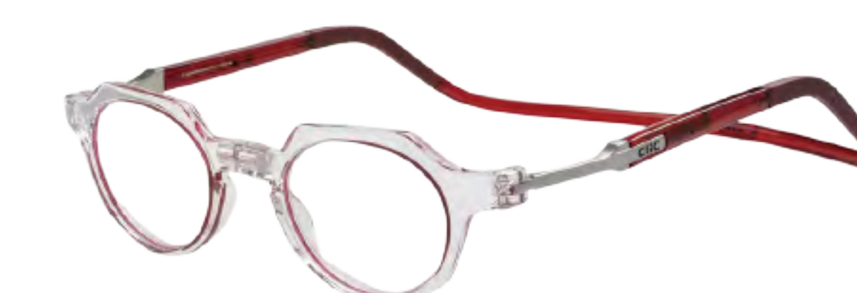
MT-4 インサイドレッド(MTIR)