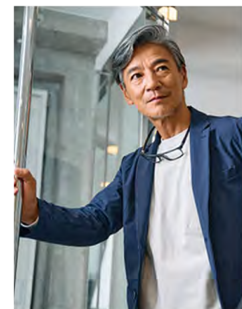
T-3 オリーブ (TOV)