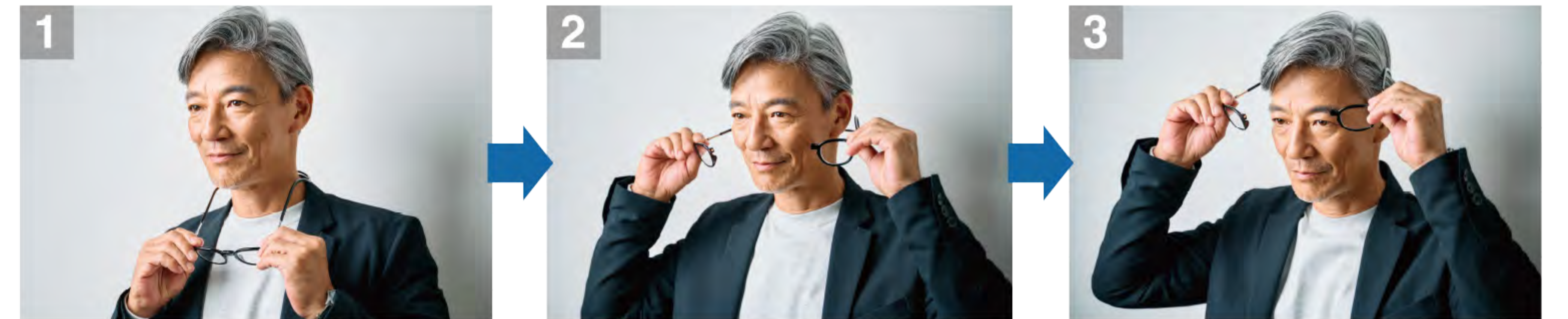
1 メガネを首にかける