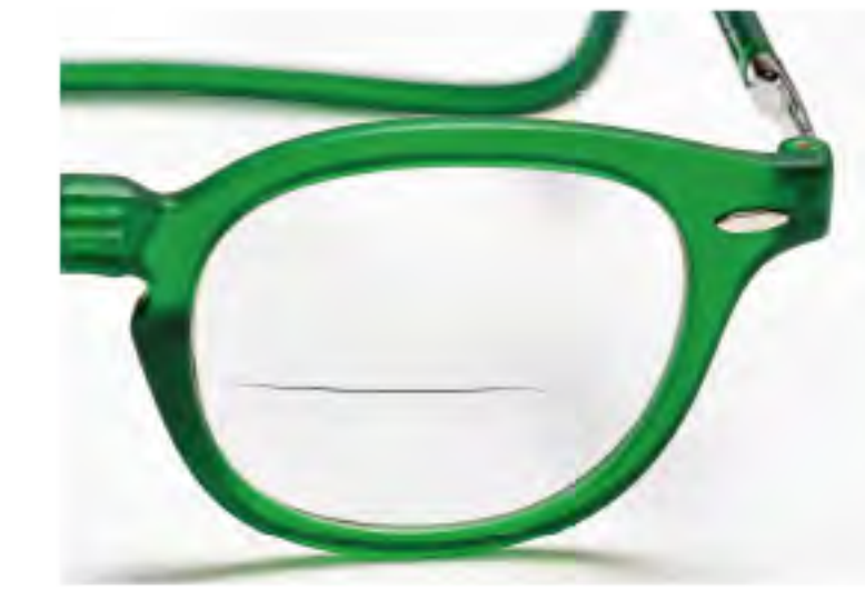
VEX-2 エメラルドグリーン (VEG-EX)