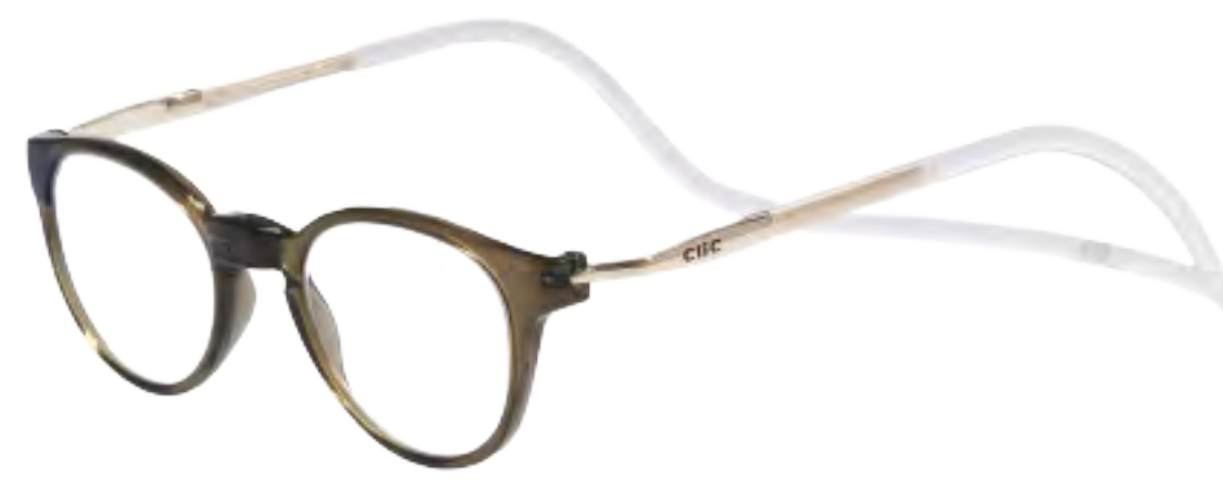
PS-4 オリーブ/マットクリアー(OMC)