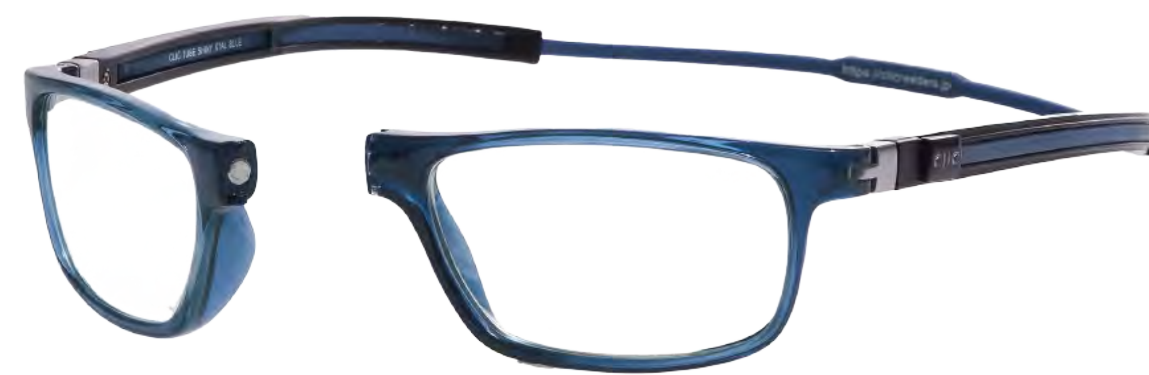
T-4 ネイビーブルー (TNB)