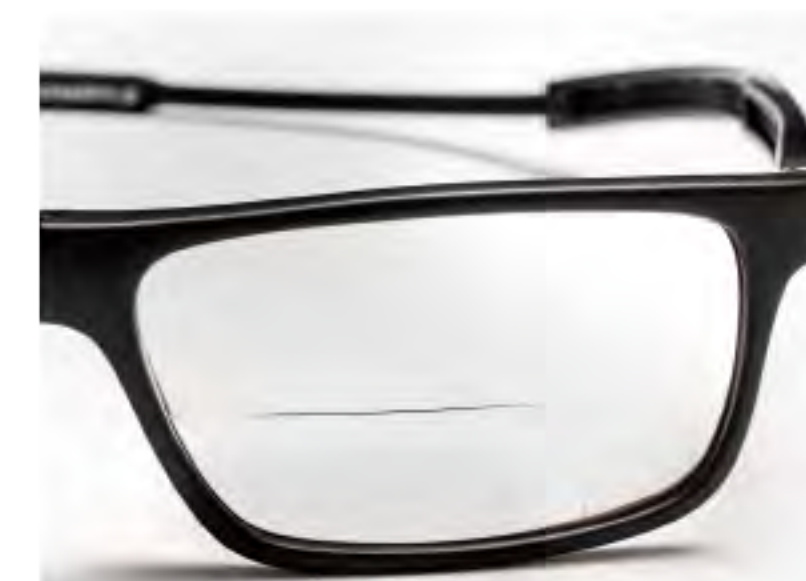
TEX-1 マットブラック (TMB-EX)